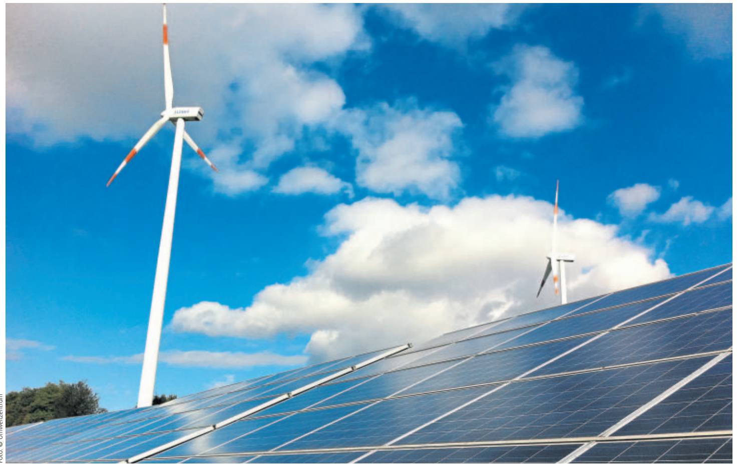
Erneuerbare Stromerzeugung aus Wind- und Sonnenenergie

EEG: Kleinere Verbesserungen für das Handwerk trotz fehlender grundsätzlicher Reform.